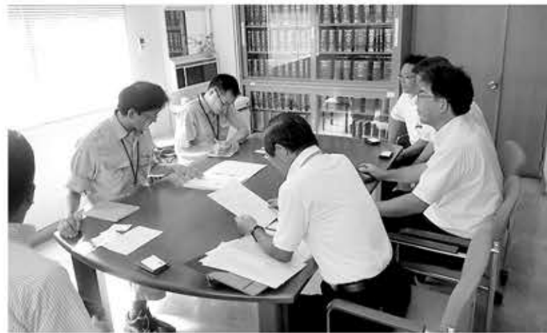
県庁に先立ち、各出先事務所に報告した